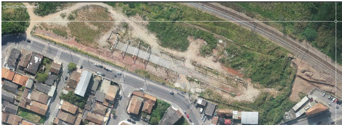
Figura 1: Imagem área do sobrevoo por drone realizado em área objeto de implantação.

2.3. Endereço: Rua Prefeito Cido Franco, Jardim Maria Paula – Rio Grande da Serra. Coordenadas: Lat.: 23°44'33.60"S e Long.: 46°23'39.31"O