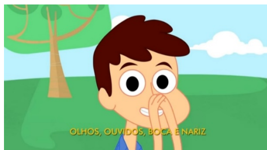
Cabeça, Ombro, Joelho e Pé - Bob Zoom | Video Infantil Musical Oficial

Vídeo Musical Bob Zoom “Cabeça, Ombro, Joelho e Pé” que encontra-se no Youtube, Através da música a criança mesmo pequenina irá aprender e reconhecer quais são as partes do seu corpo. Realize os movimentos da música juntamente com a criança dessa forma estará estimulando o desenvolvimento motor através do movimento da dança.