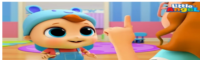
O Bebê Aprende as Partes do Corpo! 👑 | 📍 Canal do Joãozinho - Little Angel Por...

Vídeo Musical Litter Angel Canal do Joãozinho “ O Bebê Aprende as Partes do Corpo Humano” que encontra-se no youtube. Ao assistir o vídeo com a criança enfatize pra ela os nomes das partes do corpo que estão aparecendo no vídeo para que assim a criança possa interagir e conhecer as partes de seu corpo.