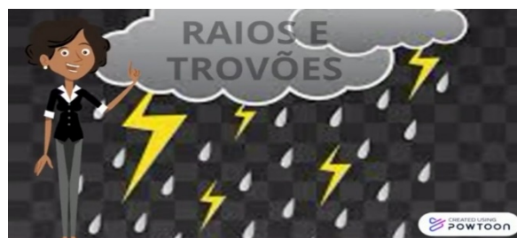
FENÔMENOS DA NATUREZA - EDUCAÇÃO INFANTIL

Vídeo história “ Fenômenos da Natureza”- Educação Infantil que encontra-se no Youtube, onde a criança poderá através da ludicidade aprender quais são os fenômenos naturais como o sol, a chuva, o vento etc..